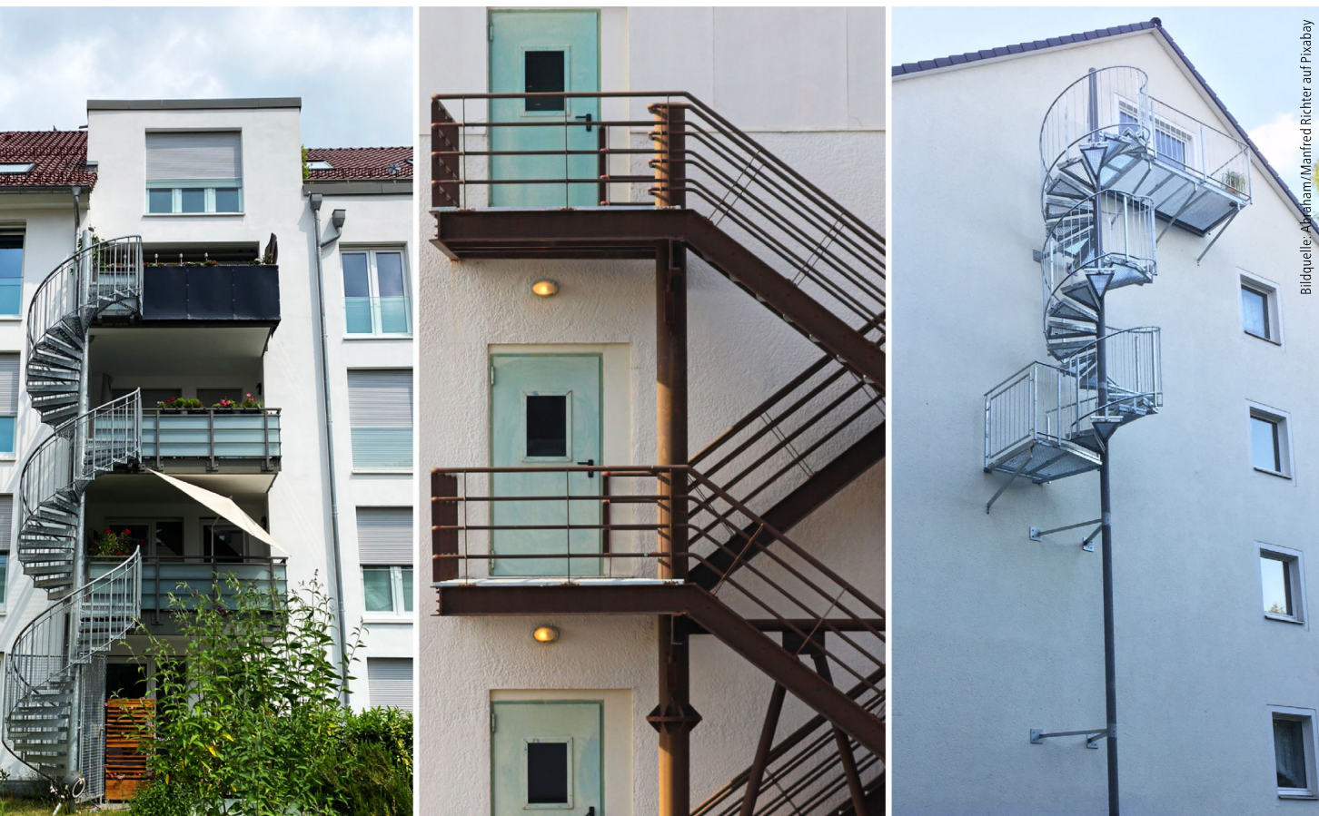
Abb. 1: Notwendige Außentreppe oder Nottreppe? In der Praxis erweist es sich regelmäßig als Problem, dass im Bauordnungsrecht nur notwendige Treppen oder Rettungsgeräte der Feuerwehr benannt werden.