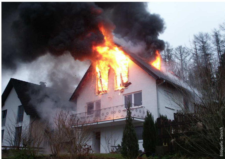
Abb. 4: Bei Brandereignissen gibt es Situationen, die eine Leiterrettung ausschließen. Dies kann z. B. bei einem Vollbrand in einer Nutzungseinheit der Fall sein.

Eine praxisbezogene Bewertung führt nämlich schnell zu der Erkenntnis, dass an eine notwendige Treppe, die lediglich als zweiter Rettungsweg dient, in aller Regel geringere Anforderungen zu stellen sind. Darum erscheint es zielführender, dass bei notwendigen Treppen, die ausschließlich den zweiten Rettungsweg gewährleisten, der Begriff der „Nottreppe“ verwendet wird, um entsprechende Klarheit hinsichtlich der Schutzbedürftigkeit dieses Rettungswegs zu schaffen. Dabei ist zu beachten, dass notwendige Außentreppen, die im Brandfall gefährdet werden können, regelmäßig ein Abweichungstatbestand sind, der entsprechend zu beantragen und zu begründen ist.