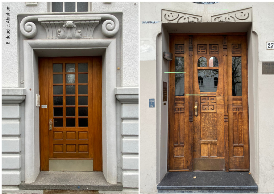
Abb. 2: Türen mit Aufschlag nach innen

E in Fallbeispiel: Für ein Wohngebäude der Gebäudeklasse (GK) 4, weit unterhalb der Sonderbauschwelle und außerhalb der Arbeitsstättenverordnung, fordert die Bauaufsicht im Zuge eines vereinfachten Genehmigungsverfahrens für die Außentür einen Türaufschlag nach außen. Sie begründet dieses mit einem Verweis auf den Kommentar zur niedersächsischen Bauordnung (NBauO) [1]. Eine derartige Anforderung findet sich jedoch weder in der NBauO noch in einer anderen Landesbauordnung (LBO) oder gar in der Musterbauordnung (MBO). Zwar ist ein Rückgriff auf § 3 NBauO in extremen Einzelfällen denkbar, für Wohnungen aber wohl kaum zutreffend. So finden sich entsprechende Forderungen eher im Arbeitsstättenrecht bzw. in Sonderbauten mit großen Menschenansammlungen. Und auch ein Blick in den zitierten Kommentar ([1] § 36 Rn. 11) lohnt: